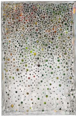
Lode Laperre, Spatial Distancing I , 2020, acrylverf op doek, 60 x 40 cm

Door het afwisselend toevoegen en wegnemen van verf creëert Lode Laperre een soort abstracte landschappen. Spatial Distancing I is onderdeel van een triptiek die de kunstenaar realiseerde tijdens de lockdownperiode. "Dit werk is een metafoor, het toont hoe ik de coronacrisis zie," zegt hij. "Je kan er een picturale vertaling van een grafische voorstelling van de verspreiding van het virus in lezen. Of een ruimtelijke voorstelling van intermenselijke relaties." Spatial Distancing I bestaat uit een speelse ritmiek van stipvormige, uitgekraste stukjes verf die zich afwisselend dicht en verder van elkaar bevinden. "Ik ben een fanatiek Azië-reiziger. Ik voel me comfortabel bij de afstandelijke, respectvolle houding die je in Oosterse landen zoals Japan aantreft. Eerbied hebben voor de ruimte en de aura van de ander vind ik bijzonder."