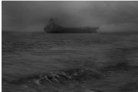
Elke Andreas Boon, the Ark , 2015, z/w fotografie, 120 x 80 cm

In het werk van Elke Andreas Boon is er steeds een fundamentele dubbelheid en een kritische onderstroom waarneembaar, een soort weerspannige sensitiviteit. De onderwerpen en het denken van de kunstenaar getuigen van een breed maatschappelijk inzicht, maar tegelijkertijd ook een bewustzijn van het niet weten. The Ark kan je lezen als een eenzaam godsbeeld van het kapitalistisch globaal systeem, maar evenzeer als een (zelf)portret, een verhouding tot vrijheid en keuzes, en de bijhorende verantwoordelijkheid. Het raakt aan een rauwe visie op de condition humaine.