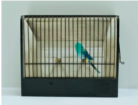
Guy Slabbinck, Buddy , 2020, olieverf op hout + mixed media, 15 x 36 x 30 cm

Of Guy Slabbinck nu schilderijen, sculpturen of videodocumentaires maakt, steeds is er een link met de geschiedenis van de schilderkunst. Buddy is een assemblage van een objet trouvé, namelijk een zogenaamde tentoonstellingskooi, gemonteerd op een in trompe-l'oeil geschilderd, bontgekleurd vogeltje. "Het werk knipoogt naar het opgelegde isolement door corona," aldus de kunstenaar. "Het is ook een kritiek op een vreemd verlangen van sommige mensen naar een zogenaamd paradijs en hier concreet naar het bezitten van een zo mooi mogelijk gekleurd, exotisch vogeltje."