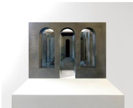
Renato Nicolodi, Statio II , 2020, messing, 21 x 21 x 15,6 cm

Voor wie ontvankelijk is voor Renato Nicolodi's fictieve, architectonische sculpturen en installaties - van schaalmodellen tot realisaties op ware grootte -, opent zich een ganse wereld. De vormentaal van zijn kleinschalige, nieuwe werk Statio II is sacraal, het doet verlangen naar iets geestelijk. De sculptuur gedijt dan ook goed in de kapel van het Maaltebruggekasteel. De titel alludeert op een - fysiek en mentaal - stilstaan bij een halte. Wie de constructie denkbeeldig betreedt, loopt onvermijdelijk tegen een blinde muur aan. Het fysieke eindpunt hoeft geen mentaal eindpunt te zijn. Mogelijk stapt de toeschouwer mee in het verhaal, misschien vormt deze muur een poort naar een onbekende wereld?