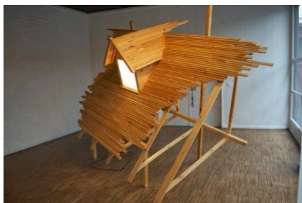
Jonas Vansteenkiste, The way you once left me , 2011, hout, plastic, dak: 300 x 6 x 175 cm, kapel: 70 x 142 x 147 cm, courtesy: Jonas Vansteenkiste

De artistieke praktijk van Jonas Vansteenkiste kenmerkt zich door een fundamenteel onderzoek naar de fysieke en psychologische ruimte. The way you once left me baadt in melancholie. We zien een deel van een dak, een ontheemd element, losgescheurd van zijn huiselijke context. Het lijkt te refereren aan een - vervaagde - herinnering van wat er ooit was. We kunnen alleen raden hoe dit fragment hier kwam, wat er mogelijk achter de schermen plaatsvond en waarom het zo huiselijk van binnenuit wordt verlicht?