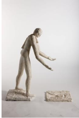
Jean Bilquin, Orpheus - het onbereikbare , 2006, gips, 107 x 95 x 28 cm

Anno 2020 is Jean Bilquin nog steeds creatief actief. In de jaren '60 en '70 bekleedde hij een volwaardige positie binnen de 'nieuwe figuratie', een kunststroming in België en Nederland die niet toegaf aan de lokroep van de conceptuele kunst, maar net trouw zwoer aan een expressieve figuratie. Geïnspireerd door het epos De Metamorfozen van de dichter Ovidius, creëerde Bilquin Orpheus - het onbereikbare . De sculptuur verwijst naar een bekend liefdesverhaal uit de Griekse mythologie Orpheus en Eurydice . De zanger Orpheus tast in het ijle, op zoek naar zijn overleden echtgenote, de nimf Eurydice. De liefde, een onmogelijk verlangen.